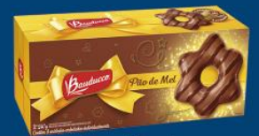
Pão de mel Bauducco especial 240 gr 5,99 cada