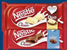
Choc. Nestlé tablete 100/98 gr 4,69 cada