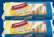
Bisc. Anchieta champagne 300 gr 4,99 cada