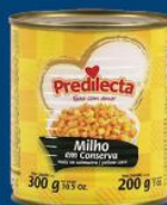
Milho verde Predilecta lt 200 gr 1,25 cada