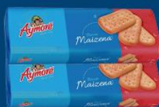
Bisc. Aymoré maizena 200 gr 1,59 cada