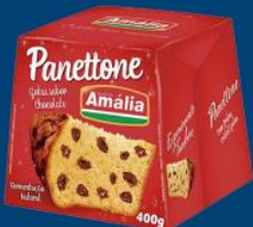
Panettone Santa Amália cx gotas de choc. 400 gr 7,99 cada