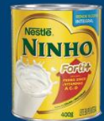
Leite em pó Nestlé ninho 400 gr inst. ou integral 10,99 cada