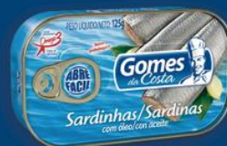
Sardinha Gomes da Costa c/ óleo 125 gr 2,99 cada