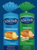
Pão de forma Visconti 400 gr 3,89 cada