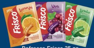
Refresco Frisco 25 gr 0,75 cada