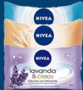
Sabonete Nivea 85 gr 1,19 cada