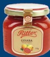
Geléia Ritter premium 310 gr 11,89 cada