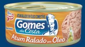
Atum Gomes da Costa ralado 170 gr 4,69 cada