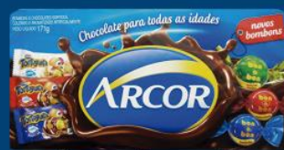
Bombom Arcor sortidos 5,49 cada