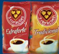
Café Três Corações trad. ou extra forte 500 gr 8,45 cada