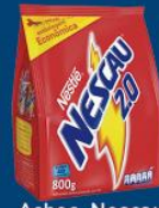
Achoc. Nescau 800 gr 7,99 cada