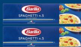
Mac. Barilla spaghetti 5 500 gr 7,39 cada