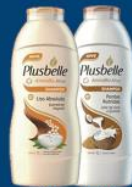
Shampoo Plusbelle 1 lt 14,99 cada