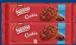
Bisc. cookie Nestlé 60 gr 1,59 cada