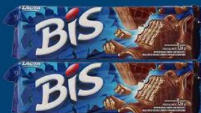
Choc. Lacta bis ao leite c/20 und 126 gr 3,69 cada