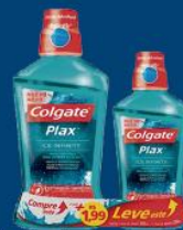
Kit Antisséptico bucal Colgate plax LV500 ml PG 350 ml + plax 250 ml 19,99 cada