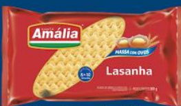
Mac. Santa Amália ovos lasanha 500 gr 5,99 cada