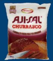
Sal grosso Ajisal churrasco 500 gr 4,99 cada

Horário de funcionamento: segunda a sexta-feira de 8h às 20h e sábado de 8h às 20h Edifício sede Supermercado Escola, s/nº - Campus UFV - Viçosa/MG